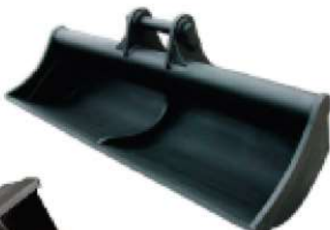
CAZO DE LIMPIEZA