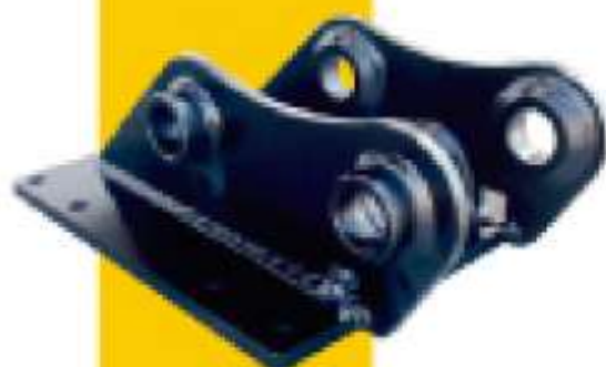
SOMBREROS PARA MARTILLOS