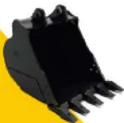
CAZO DE EXCAVACIÓN