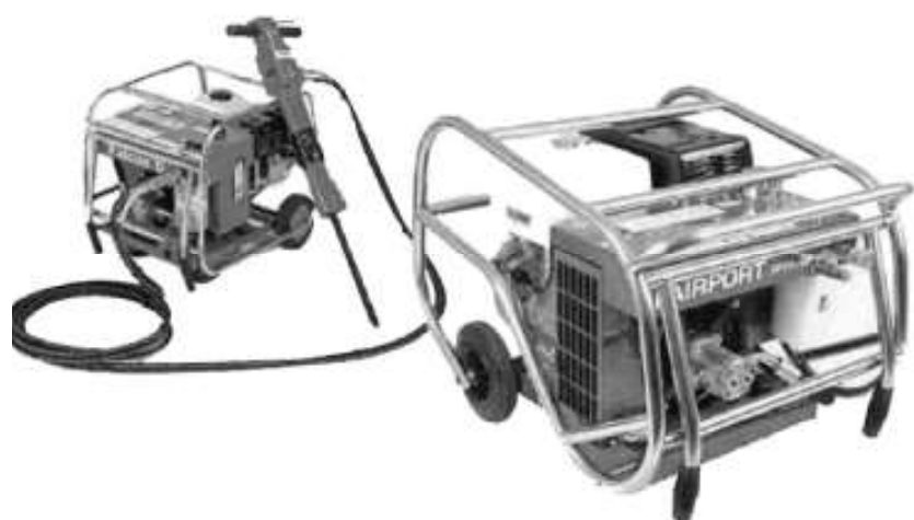
Hoyador hidráulico de uso manual