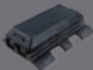
teja Bolt-On extendidas de asfalto