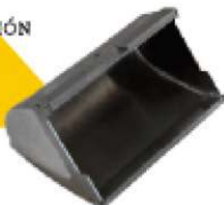
CAZO A MEDIDA