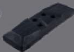
teja de goma Chain-On