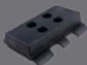
teja de Goma extendidas de asfalto

Las tejas y tacos de goma para cadenas metálicas están fabricadas con los mejores materiales primas y permiten, a las mini excavadoras con cadenas metálicas, la posibilidad de trabajar en suelo urbano con las mejores condiciones de agarre y tracción.